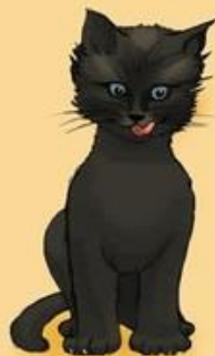
Le Petit Chat Edmond Rostand

C'est un petit chat noir effronté comme un page, Je le laisse jouer sur ma table souvent. Quelquefois il s'assied sans faire de tapage, On dirait un joli presse-papier vivant.