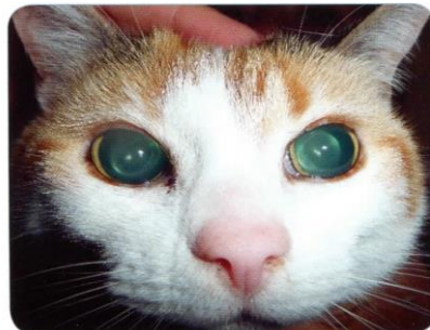
Figure 2: les pupilles sont dilatées et ne répondent pas à la lumière

Car si l'œil "attire le regard", cela peut cacher d'autres lésions ultérieures sur d'autres organes "cibles" : rein, cerveau, cœur.