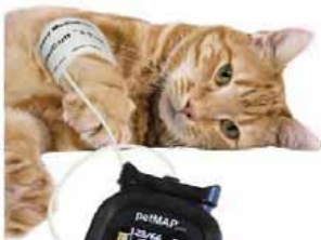
Placement du brassard sur la patte avant (en dessous de l'articulation)

Comme chez les humains, il faut utiliser un tensiomètre