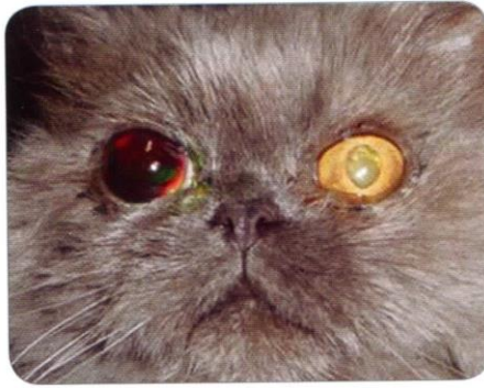
Figure 3: Saignement dans la chambre interne formant un hyphéma