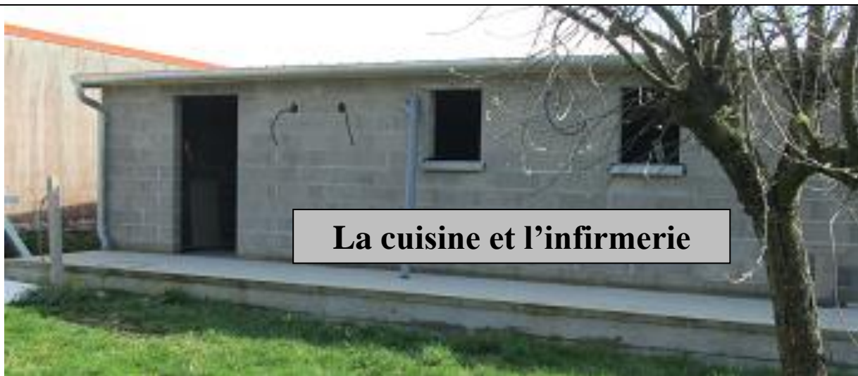
La cuisine et l'infirmierie