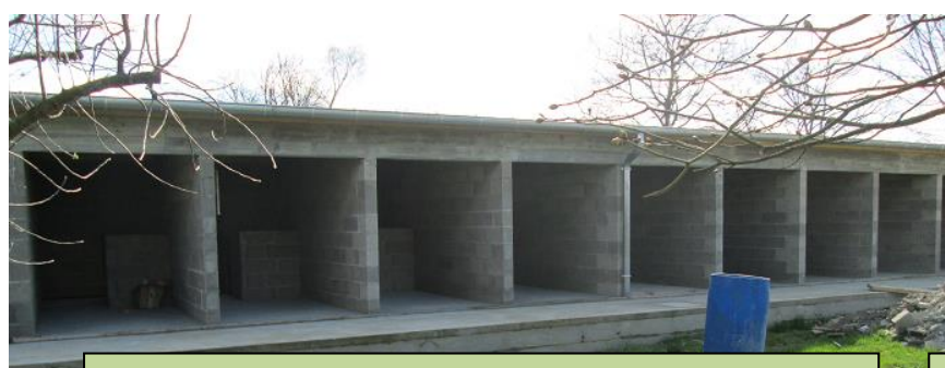
14 box pour accueillir nos chiens