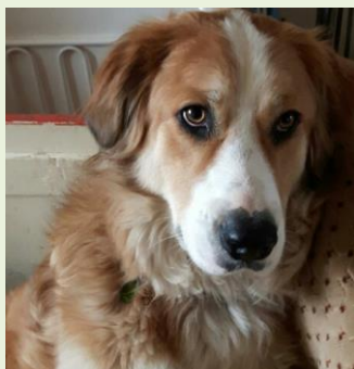
Le regard de DOUCHKA