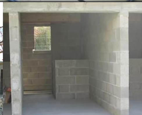
Box pour 1 chien